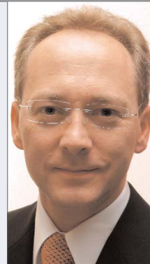
Autor Jörg Weinert, Produktmanager systemaPACS, systema Deutschland GmbH

Im einfachsten Fall werden die DICOM-E-Mails auf Empfängerseite von einem DICOM-Mail-Client empfangen und angezeigt. Hierbei werden die Datenpakete automatisch zusammengesetzt und